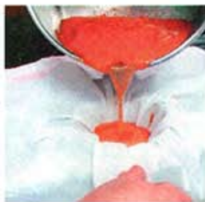
PHASE 2: Durchs Tuch gefiltert, entsteht Feinsucco, eine Basis für Fonds.

wird auch in Melichars gutbürgerlichem Landgasthaus nach diesen Prinzipien gekocht. Wer allerdings mehr über die Succowell-Tricks erfahren und vor allem auch wissen möchte, was der frühere Dreihaubenkoch Melichar stilistisch alles draufhat, der bucht am besten einen Succowell-Kurs, dessen Höhepunkt ein mehrgängiges Succowell-Menü im chic-eleganten, aber nur bei Vorbestellung geöffneten Gourmetstüberl das Hauses ist.