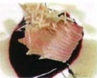
... sich für Saucen ebenso wie für ...