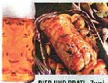
BIER UND BRATL. Zwei große Stützen der österreichischen Lebenskultur.

In diesem Heft finden Sie ab Seite 98 den großen NEWS-Biertest, der längst eine österreichische Institution in Sachen Genuss und Lebensfreude geworden ist. Dennoch muss man dieser Tage aufpassen wie ein Hafelmacher, dass man sich nicht um Leib und Seele schreibt, wenn man die Freuden, die uns Bacchus und Gambrinus bescheren, zu sehr preist. Da kann es nämlich passieren, dass einem die Frau Gesundheitsminister Kdolsky auf die Finger klopft. Sie gibt zwar selbst freimütig zu, vor einem halben Jahr „ein Glaserl zu viel“ erwischt zu haben, aber sie strafte