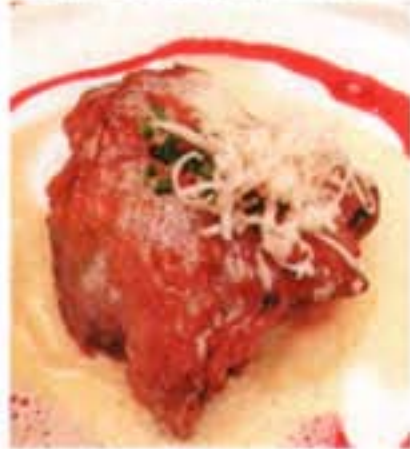
... Fonds, Sulzen und Aufstriche.