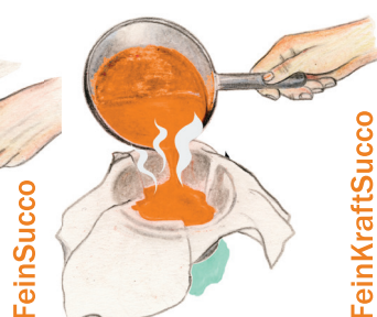
Kochend heiß filtrierter NaturSucco